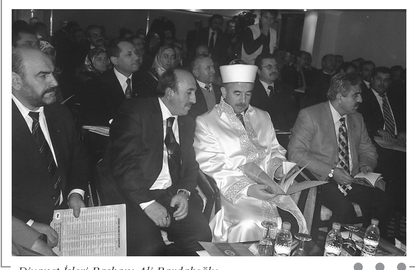
Diyaret İşleri Başkanı Ali Bardakoğlu Diyaret-Sen Başkanlar Kurulu Toplantısı - 2004