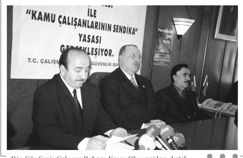
Din Gör-Sen'e Çalışma Bakanı Yaşar Okuyan'dan destek Mart - 2001