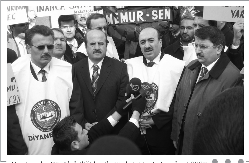
Danimarka Büyükelçiliği karikatür krizi protesto eylemi 2007