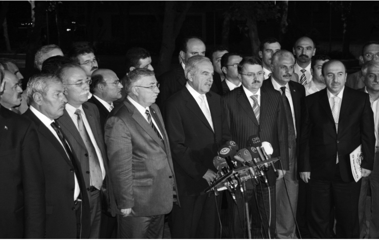
Diyanet-Sen 2008 yılı toplu görüşmelerinde.