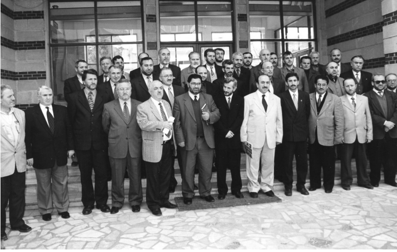
Sendika kurulmadan önce İstanbul din görevlileri Sendika istişare toplantısı - 1998