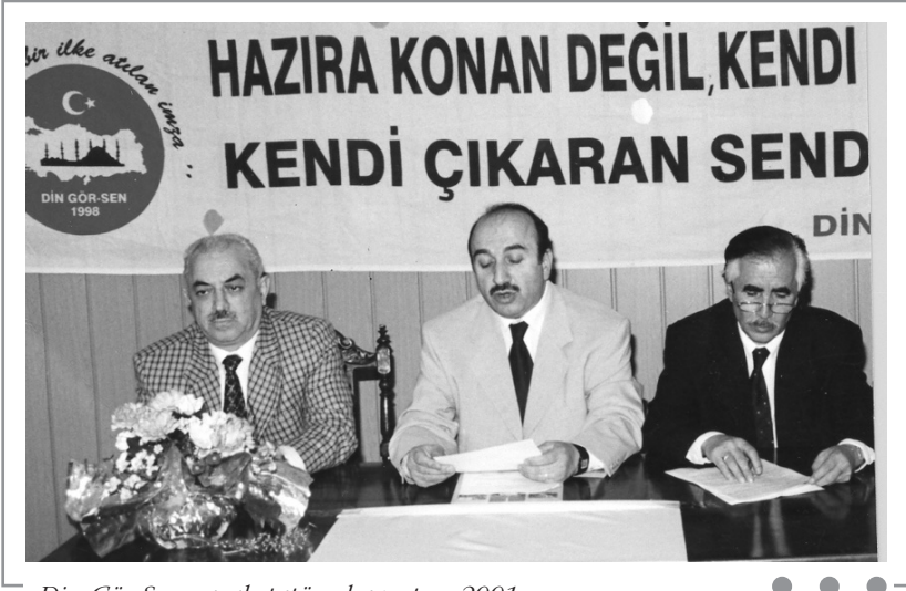
Din Gör-Sen yasal statüye kavuştu - 2001