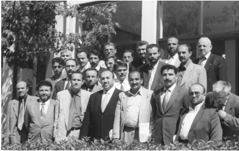
Başkanlar Kurulu Toplantısı