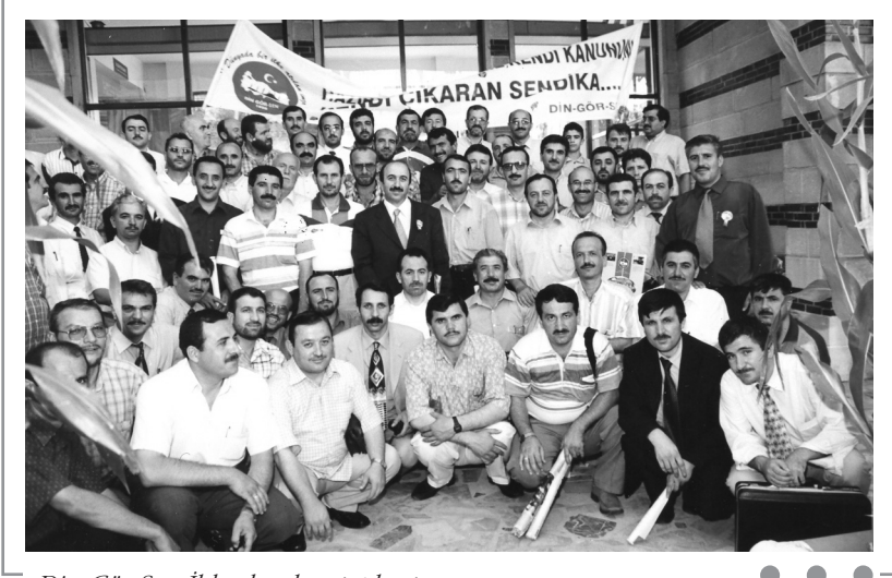
Din Gör-Sen İl başkanları toplantısı Eyüp - İSTANBUL - 2001