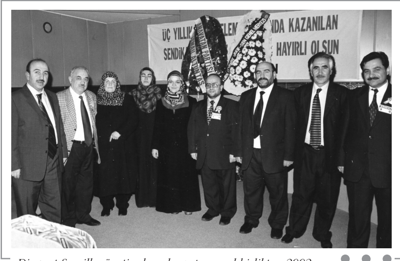
Diyanet-Sen ilk yönetim kurulu ve personel birlikte - 2002