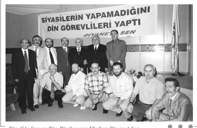
Din Gör-Sen ve Din Bir-Sen sendikaları Diyanet-Sen adı ile birleştiler- 2002