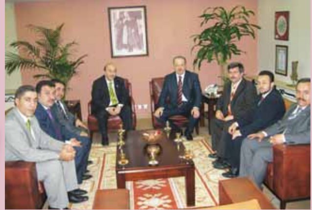
Manisa Belediye Başkanı'yla Camilerin temizliği konusunda görüşüldü