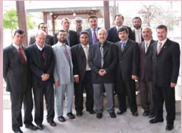
Akhisar İlçe Temsilciliği ziyaret edildi