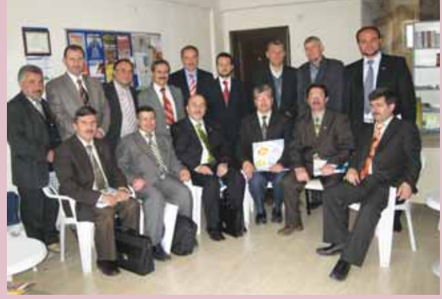
Salihli'de Manisa İl Divan Toplantısı gerçekleştirildi

Yıldız açıklamasında güncel olayları da değerlendirerek AK Parti'ye açılan kapatma davasını siyasi bir karar olarak gördüklerini ve Ergenekon ile bağlantılı olduğunu düşündüklerini