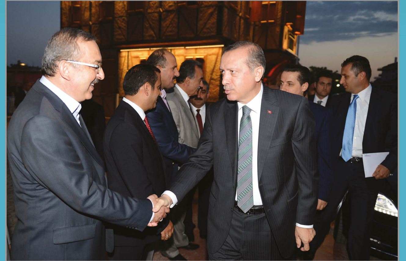
Başbakan Erdoğan Memur-Sen Büyük Türkiye Buluşmasına Katıldı