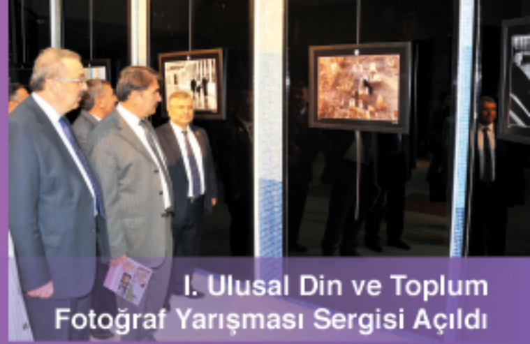
I. Ulusal Din ve Toplum Fotoğraf Yarışması Sergisi Açıldı