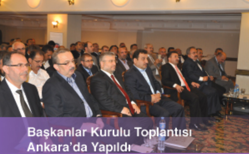
Başkanlar Kurulu Toplantısı Ankara'da Yapıldı

TÜRKİYE İZANET ve VAKIF GÖREVLİLERİ SENDİKASI DERGİSİ • EKİM 2013