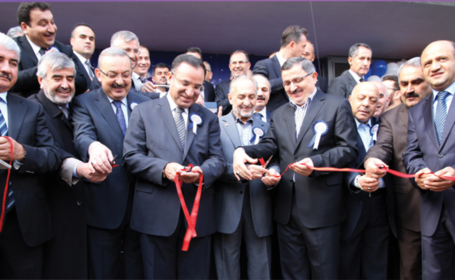
Genel Merkez Yeni Hizmet Binamız Dualarla Açıldı