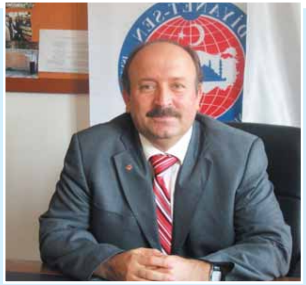
Genel Mevzuat ve Toplu Görüşme Sekreteri

Bunların zamanla baş gündemi değişmektedir. İran'da iktidar değişince acaba Türkiye İran olur mu? İran devletinin parayla üniversite öğrencilerini kapatmaya çalıştığı söylendi. Bazen arada bir cübbe, sakal ve çarşaf dille getirilmekte, arada bir de dini konuşma yapanların ipin ucunu kaçırmaları ve rejim için tehlike doğurdukları dille getirilmektedir. Bazen dini nikâhla aile kuranlar dille dolanmaktadır. Seçimden önce Cumhurbaşkanı seçtirmemek için üç yüz atmış yedi sayısı gündemdedi. Fakat seçim bu işi çözünce bunu fazla gündemde tutmaya yüzleri kalmadı. Başka konular bulma yoluna gittiler. Seçimler bitti. Meclis Cumhurbaşkanı seçti ve hükümet de kuruldu. Hükümeti kuran siyasi parti seçim beyanmesinde halka verdiği sözü yerine getirmek için yeni anayasa çalışmalarını başlattı. Hemen yeni bir gündem oluşturdular. Bunların amacı rejimi değiştirmek, inkılâpları ve laikliği işlevsizleştirmektir. İddiaları arka